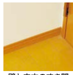
壁と巾木のすき間