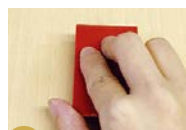
2 ゴシゴシスクレーパーで充填部分を平らにする