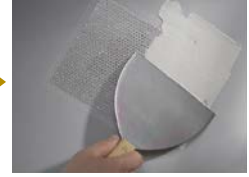
②パテを全体に塗り付け(下塗り)ヘラ等で平らになぞります。