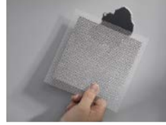
①穴を覆い隠すようにアルミパッチを貼り付けます。