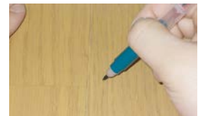
木目を描くとさらに仕上がり良くなります。

キャンディルデザイン 大工さんの補修箱 228-3003 1セット オープン価格