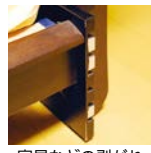
家具などの剥がれ